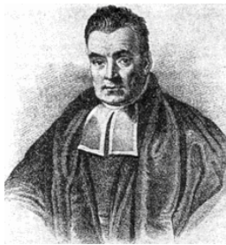
Thomas Bayes (environ 1702-1761)